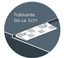
FLEYG EDGE® Low