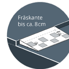
FLEYG EDGE® High

Da es über Jahre eingesetzt werden kann ist der FLEYG EDGE® bereits nach wenigen Einsätzen amortisiert.